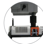
Rapido sganciamento della base dal corpo macchina Quick release of the foot from the base for inspection