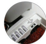
Selettore per regolazione altezza rullo Selector to adjust the height of the agitator from the carpet