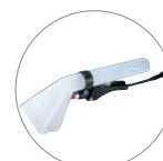
Bocchetta optional per poltrone e divani Optional tool for armchairs and sofas